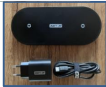
Foto del prodotto Picture of the item

L'oggetto descritto è conforme alla pertinente normativa di armonizzazione dell'Unione: The described object of the declaration is in conformity with the relevant Union harmonisation legislation: