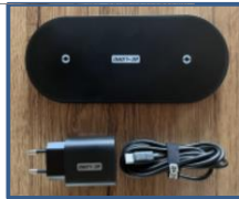
Foto del artículo Picture of the item

El objeto descrito se ajusta a la legislación pertinente de armonización de la Unión: The described object of the declaration is in conformity with the relevant Union harmonisation legislation: